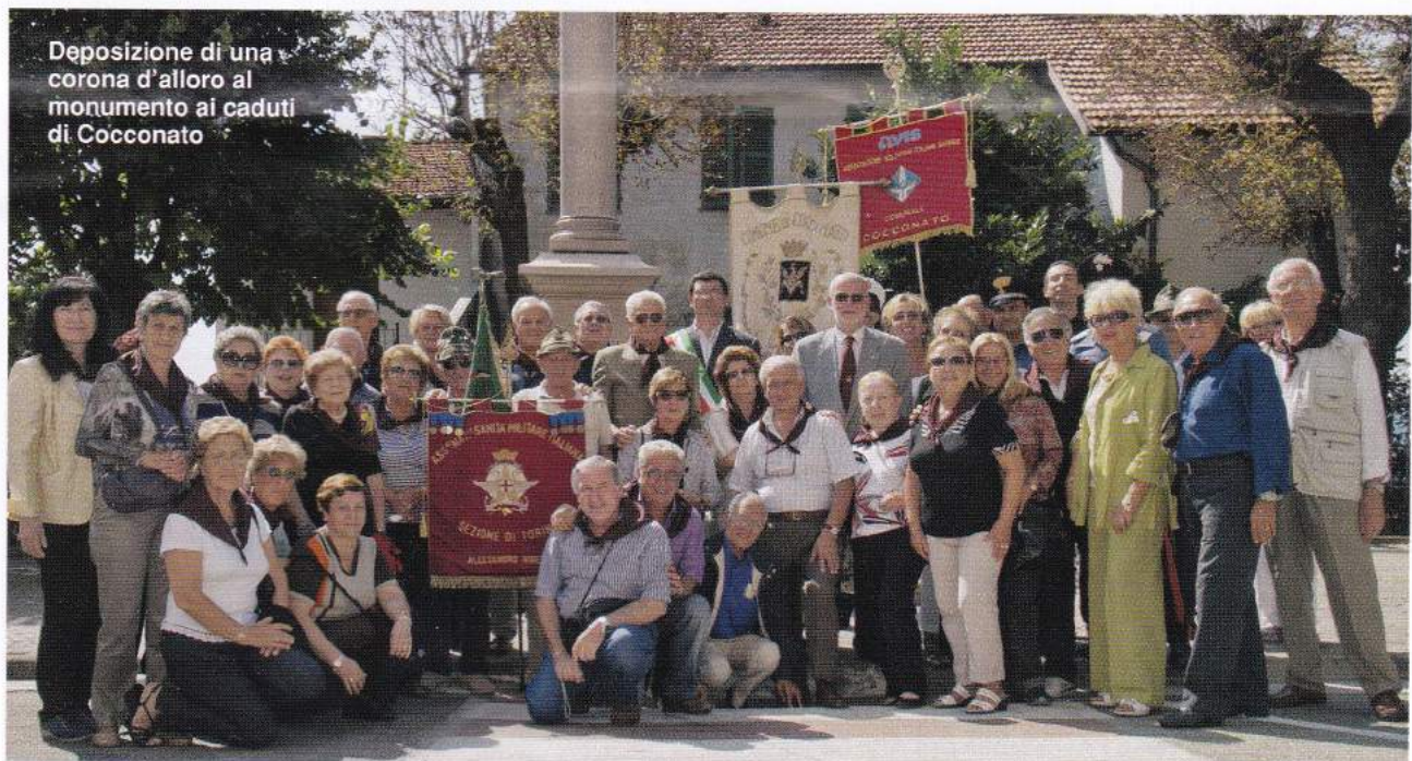
Deposizione di una corona d'alloro al monumento ai caduti di Cocconato

Subito dopo la cerimonia siamo partiti per Roma, dove siamo arrivati alle 21.00 circa. (N.S.)