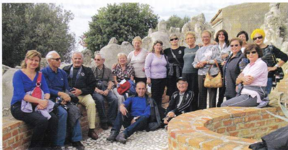
Parte del gruppo in visita al museo dei mostri in Sciacca