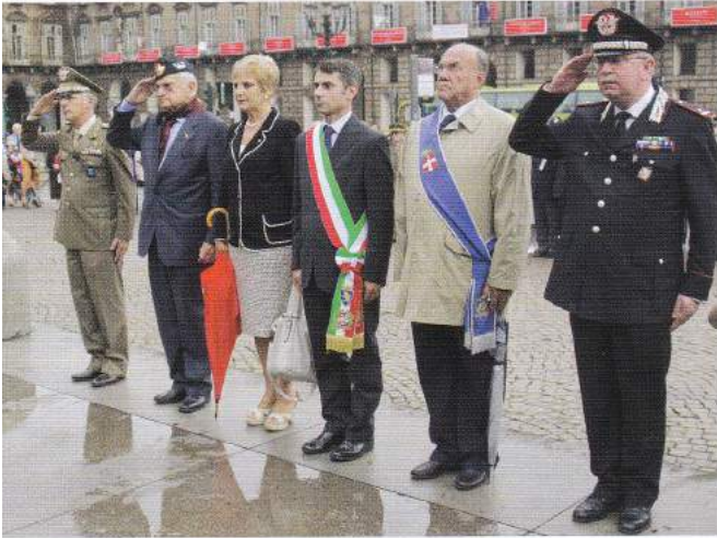
Deposizione della corona d'alloro al monumento di Emanuele Filiberto Duca d'Aosta

na. Ora non racconterò per filo e per segno tutti i luoghi visitati, perché, francamente, è difficile sintetizzare il tutto nel limitato spazio del Notiziario.