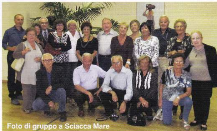
Foto di gruppo a Sciacca Mare

endoci gustare tutte le specialità che ogni giorno ci presentava; un grazie ancora ai ragazzi dell'Animazione che con la loro simpatia hanno allietato il nostro soggiorno al Cala Regina, coinvolgendoci in alcuni sckec nei loro spettacoli serali. A questo, aggiungo ancora di essere stati baciati dalla fortuna