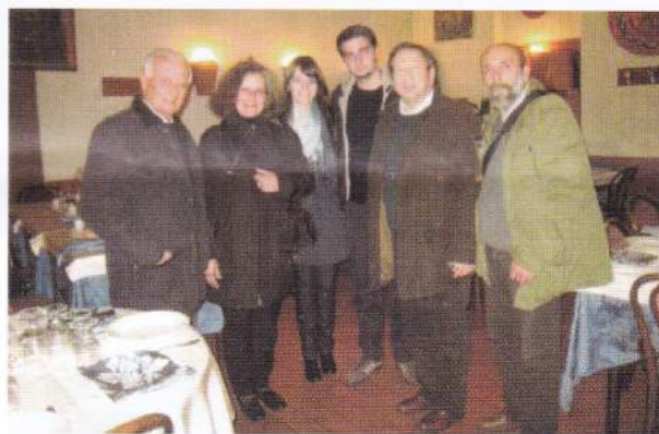
Roma, 18 novembre 2011. Incontro conviviale tra esponenti dell'ANSMI Sezione di Roma e dell'Università di Cluj-Napoca