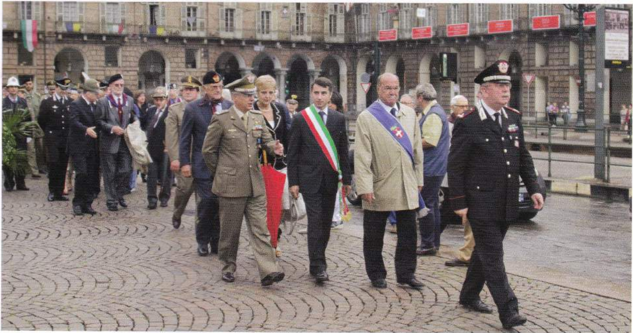
Sfilata in piazza Castello con autorità politiche, civili, militari e religiose. Sotto, la Real Chiesa di San Lorenzo, messa in suffragio dei caduti del corpo della Sanità Militare

A dempiendo all'invito della Presidenza Nazionale ANSMI, la Sezione di Roma ha partecipato con un nutrito gruppo di soci alle celebrazioni del 150° Anniversario dell'Unità d'Italia ed al 7° Raduno Nazionale che si è tenuto a Torino dal 16-18 settembre u.s.