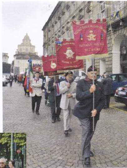
Sopra e a sinistra, Labari delle Sezioni d'Italia sfilano in piazza Castello. In basso, Confaloni della Regione Piemonte, Provincia, Comune e Labari delle Sezioni ANSMI al cimitero monumentale di Torino per depositare una corona d'alloro al Gen.me Alessandro Riberi

piemontese e della Valle d'Aosta, panorami stupendi e valli con luoghi famosi ed importanti di villeggiatura e sciistici. Molto significativo è stato il giorno seguente, quando dopo aver visitato esternamente il Castello di Moncalieri, ci siamo diretti verso la cittadina di Cocconato, dove abbiamo visitato la fabbrica del cioccolato "Bessone", le Cantine "Bava" con degustazioni di prodotti tipici piemontesi e di varie qualità di vini e spumanti. Alle ore 12.30 previ accordi presi dalla no-