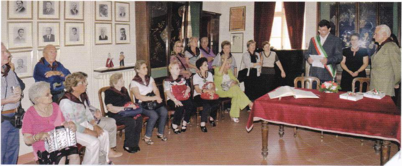
Il sindaco di Cocconato saluta il Presidente Nazionale ANSMI e il gruppo della Sezione di Roma