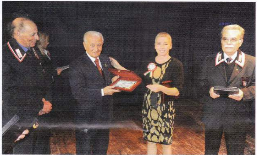
Il Presidente Emerito della Camera dei deputati dott.ssa Irene Pivetti consegna una targa a ricordo alla Sezione di Roma dell'ANSMI

In mattinata, aprendo questa giornata di festa, si sono svolti tornei di calcio fra le varie polisportive. Il momento clou della cerimonia è stato nel tardo pomeriggio, nel teatro della Chiesa di San Luca, quando la Fanfara dei Carabinieri ha intonato l'Inno di Mameli e, tutti in piedi, abbiamo cantato, con gli alunni delle Elementari "Fratelli d'Italia". Subito dopo si sono esibiti sul palco cantanti famosi al pubblico televisivo, e gli studenti liceali si sono cimentati in poesie e balletti, davanti ad una vasta platea di importanti Personalità Politiche, Civili, Militari e Religiose. Durante la cerimonia sono stati premiati da Personalità Politiche, del mondo imprenditoriale e delle FF.AA, molti giovani che si sono distinti nelle varie discipline durante