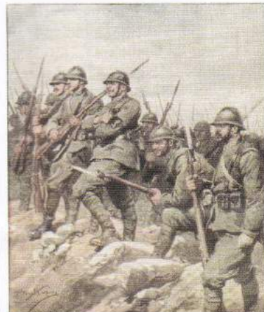
"I Ragazzi del 99" entrano in linea

Li ho visti i ragazzi del 99 andavano in prima linea cantando. Li ho visti tornare in esigua schiera: cantavano ancora.