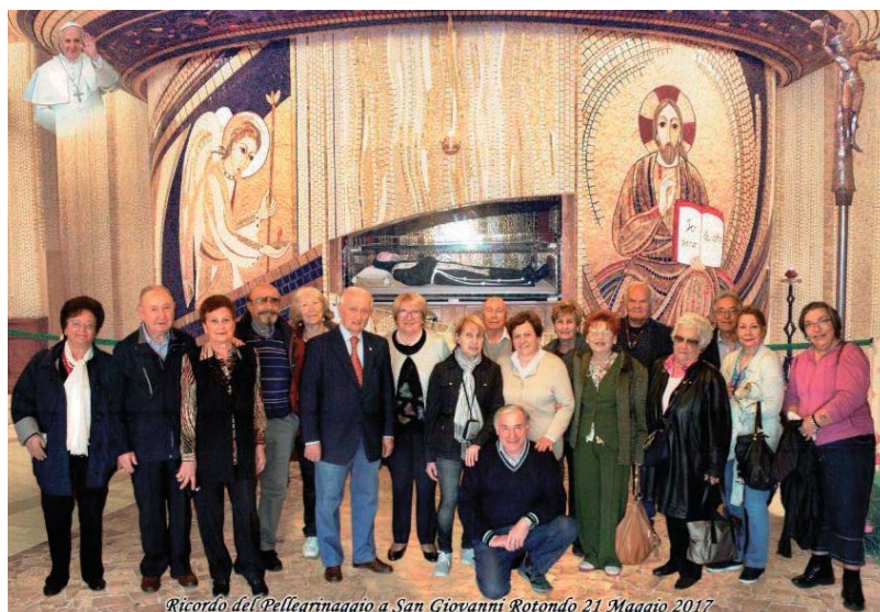
Ricordo del Pellegrinaggio a San Giovanni Rotondo 21 Maggio 2017

In serata ci siamo trasferiti a San Giovanni Rotondo dove abbiamo preso possesso delle camere. Dopo la cena il gruppo ha partecipato alla Fiaccolata intorno al nuovo Santuario. Il giorno seguente dopo aver assistito alla S. Messa nel nuovo Santuario abbiamo visitato la Cripta dove è custodito il corpo di San Pio da Pietrelcina e successivamente la vecchia chiesa. Dopo il pranzo siamo ripartiti per Roma.