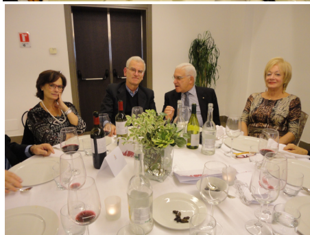
Durante la cena

tavoli, dove si è creato un piacevole clima di affiatamento. Ci si saluta con un caloroso arrivederci ..... al prossimo incontro.