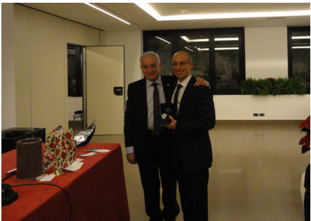
..... quello del 2° premio