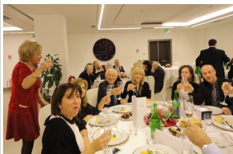
Il brindisi finale

doro e panettone compresi. Calici levati..... Buon Natale ed un Felice Anno nuovo a tutti.