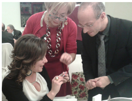
Si scarta un premio

cena terminata con la pregustazione di tipici dolci natalizi, pan-