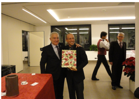
Il vincitore del 3° premio

Momento suggestivo è stato quello della vendita all' asta delle carte, abilmente condotta dal banditore Lagattolla, alle quali era legato il destino di ciascuno degli acquirenti. Così tra lazzi, facezie, ironie, fortuna e ..... sfortuna si