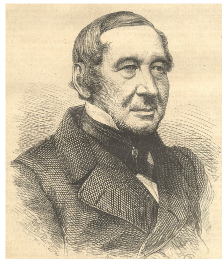
Johann Nicolaus von Dreyse

la polvere di innesco. Questa viene fatta esplodere dal' ago di accensione lungo e appuntito che