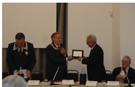
..... e al Gen. Donvito