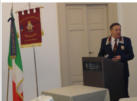
L' intervento del Presidente Nazionale gen. Tontoli

A chiusura dei lavori è intervenuto il Presidente Nazionale Gen. Tontoli che dopo i rallegramenti per la riuscita serata, ha voluto puntualizzare la necessità di rior-