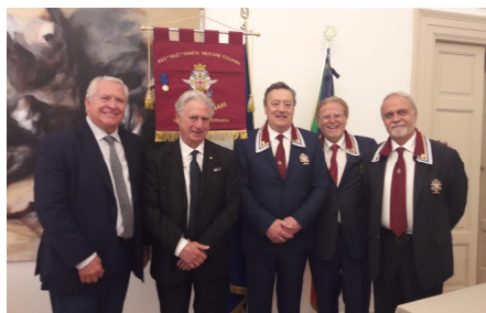
Foto ricordo con alcuni illustri ospiti