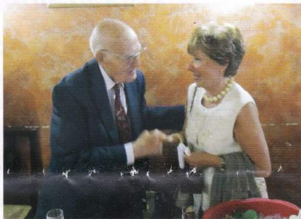
Generale Angelo Fisicaro e signora Rita Stornelli