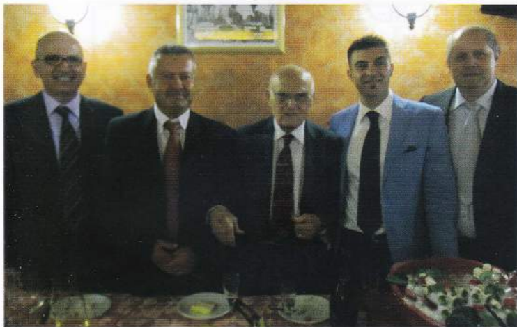
Gruppo Carabinieri di Villa Fonseca

medaglia di Roma Capitale. Unico rammarico, da parte mia e di tutti i soci della Sezione di Roma, è stato la totale assenza dei Vertici della Sanità Militare Esercito in attività di servizio, che non hanno saputo cogliere l'occasione, unica, di presenziare ad una così importante cerimonia di un loro collega medico in occasione del Suo centesimo genetliaco. In altre As-