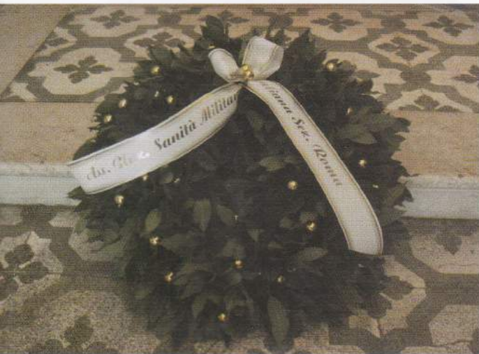
La corona d'alloro della Sezione ANSMI di Roma presso l'ossario di Solferino