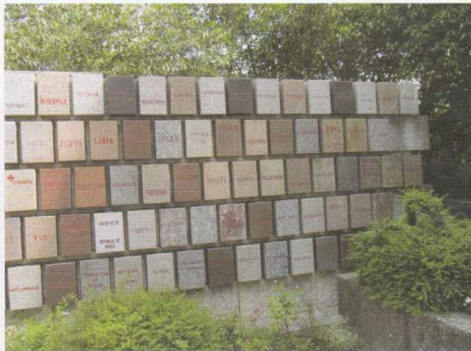
Varie ceramiche con le scritte di tutti gli Stati aderenti alla Convenzione di Ginevra della Croce Rossa

stati aderenti. Successivamente abbiamo visitato la Rocca e la chiesa parrocchiale.