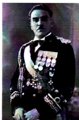
Il pluridecorato di Medaglia d'Oro al Valor Militare il Capitano di Corvetta Luigi Rizzo

militare... ma vorrei cogliere quest'occasione soprattutto per esprimervi... la mia ammirazione per come la Marina Militare Italiana sta dando una prova del tutto senza precedenti, quella cioè dell'Operazione "Mare nostrum". Questa operazione ha posto l'Italia all'avanguardia nello sforzo per reagire correttamente all'ondata di disperazione che proviene dall'Africa...e vediamo la generosità, lo slancio veramente ammirevole con cui i marinai italiani fanno fronte a questa emergenza. Questo è il messaggio che vorrei trasmettervi. Esso riguarda direttamente vostri colleghi più grandi, già impegnati nell'esercitare le loro