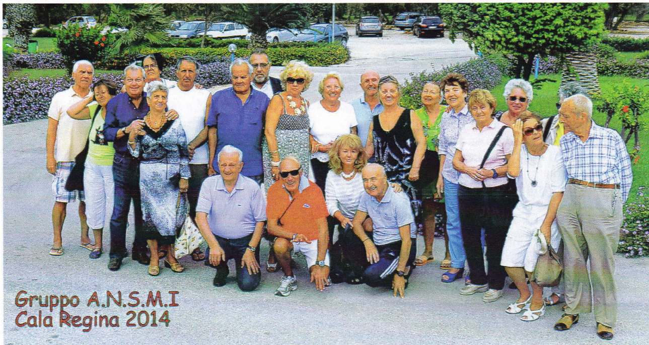
Gruppo A.N.S.M.I. Cala Regina 2014