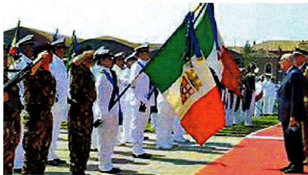
Il Presidente della Repubblica Giorgio Napolitano saluta la bandiera della Marina Militare

militare... ma vorrei cogliere quest'occasione soprattutto per esprimervi... la mia ammirazione per come la Marina Militare Italiana sta dando una prova del tutto senza precedenti, quella cioè dell'Operazione "Mare nostrum". Questa operazione ha posto l'Italia all'avanguardia nello sforzo per reagire correttamente all'ondata di disperazione che proviene dall'Africa...e vediamo la generosità, lo slancio veramente ammirevole con cui i marinai italiani fanno fronte a questa emergenza. Questo è il messaggio che vorrei trasmettervi. Esso riguarda direttamente vostri colleghi più grandi, già impegnati nell'esercitare le loro