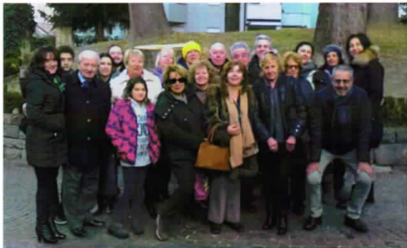
Il gruppo dei partecipanti ai mercatini di Natale a Merano

Dal 25 al 29 novembre u.s. su sollecitazione di alcuni soci abbiamo intrapreso un breve viaggio di 5 giorni in Alto Adige per visitare i mercatini di Natale.