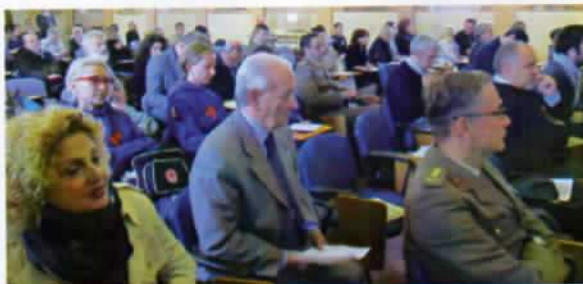
SOPRA, i partecipanti al Congresso.