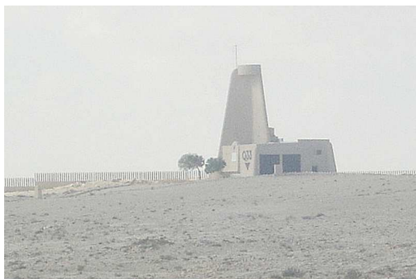
la base Italiana di "Quota 33" ad El Alamein