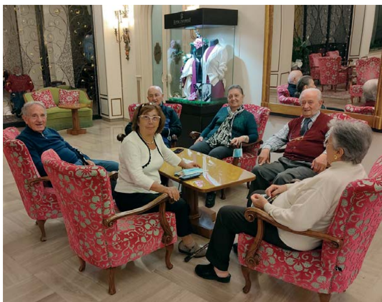
Alcuni Soci partecipanti

Ricordo inoltre che l'hotel Buja Ariston Molino praticherà uno sconto a tutti i soci che vorranno effettuare un ciclo di cure presso tale struttura. Per ottenere lo sconto i soci dovranno telefonare alla Sezione Tel. 06 7001405 – Cell. 347 9448958. La Sezione provvederà a fare la prenotazione per il socio e rilasciare un documento per usufruire lo sconto.