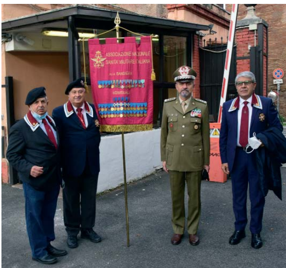
Momenti della Cerimonia in occasione del Consiglio Nazionale depositando una corona d'alloro al cippo dei Caduti della Sanità Militare nel complesso Militare di Villa Fonseca in Roma