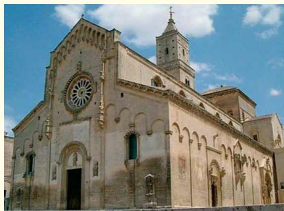
Basilica Pontificia Cattedrale di Maria Santissima della Bruna e Sant'Eustachio.

Confido nella partecipazione di molti di voi, per rendere possibile questa uscita dopo 2 anni di Covid e raggiungere il numero minimo comunicato di partecipanti.